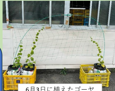
6月3日に植えたゴーヤ

始めたばかりでまだまだ小さいですが、日を追う毎に大きくなっており、これからの成長がとても楽しみです。