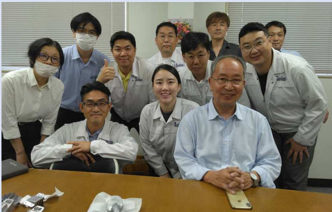
今回の鑄造セミナーにはLJとLKのQCメンバーも参加しました