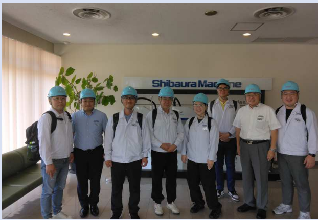
芝浦機械さんで韓国工場メンバー記念撮影