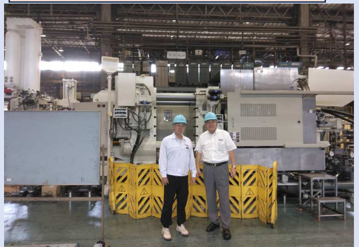
1300t 大型鑄造機の製造工程