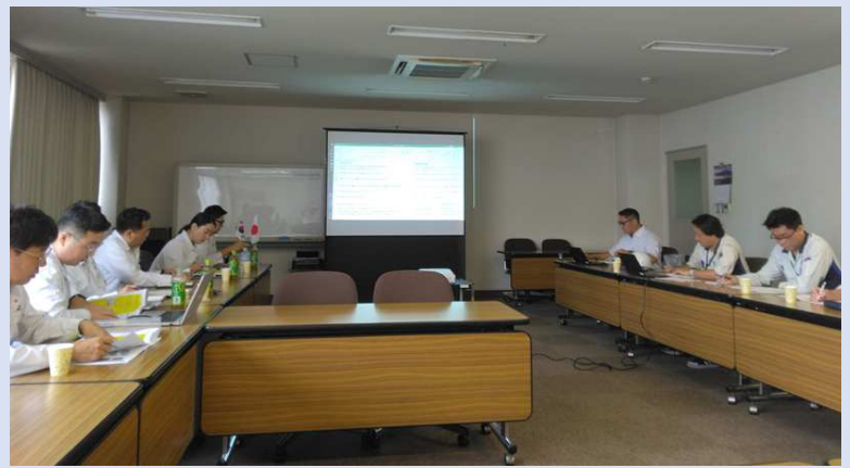
活発で有意義な検討会でした